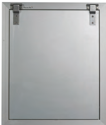
Ouvrant en position d'attente fermée.