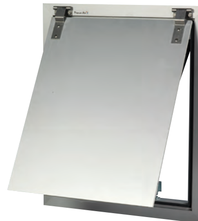
Ouvrant en position désenfumage ouvert

DOCUMENTS TECHNIQUES DISPONIBLES SUR INTERNET