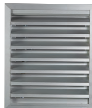
Ouvrant en position désenfumage ouvert